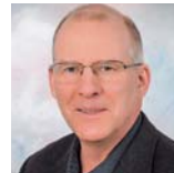
Harald Fritzsche Microdul AG